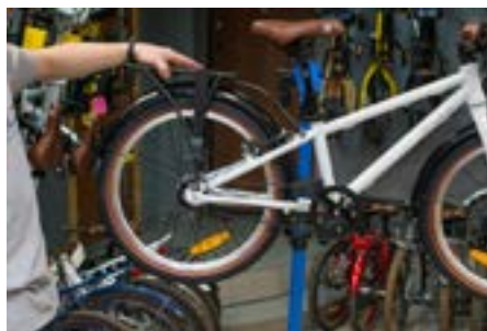
5а) Установите багажник на велосипед так, чтобы крепежные отверстия совпадали с отверстиями на раме велосипеда.