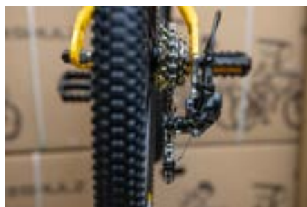
5) Установка багажника