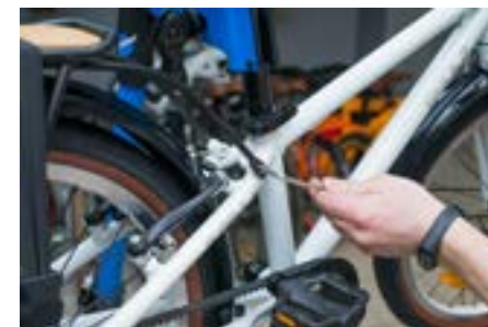
5с) Затяните 4 болта крепления багажника (шестигранник 4 мм, усилие 10 Nm).