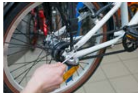
5b) Закрутите на несколько оборотов 4 болта крепления багажника из набора крепежа (шестигранник 4 мм).